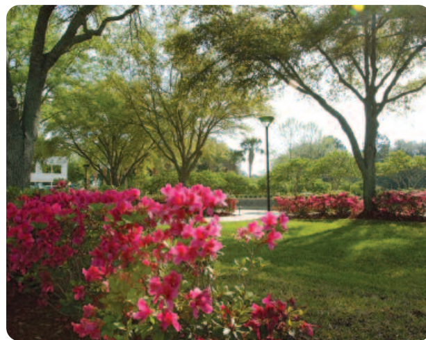
Hay muchos espacios agradables para pasar el tiempo entre citas en el campus de la Clínica Mayo.

Su programa indicará los horarios y lugares de sus citas. Use el mapa del campus en las páginas 16 – 17 como referencia. A usted se le asigna un mesón de recepción específico y edificio basado en la ubicación de su médico de la Clínica Mayo. Los mesones están identificados por piso y punto cardinal. Por ejemplo, Mayo 2 Oeste es el segundo piso del Edificio Mayo. Davis 4 Norte está en el cuarto piso del Edificio Davis. En todo el campus se pueden encontrar mapas y letreros que indican los caminos hacia cada lugar.