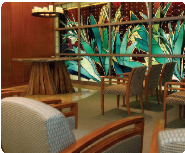
Cahill Meditation Atrium en el Edificio Cannaday ofrece un espacio de reflexión para pacientes y visitantes.

Alcohol para friccionarse las manos, papel y mascarillas se encuentran disponibles en las entradas y mesones.