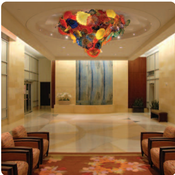
Una lámpara de vidrio soplado del renombrado artista Dale Chihuly es la pieza central del vestíbulo del hospital.

Department of Development Mayo Clinic 4500 San Pablo Road Jacksonville, FL 32224 (904) 953-7152 o (800) 297-1185 www.mayoclinic.org/development ó e-mail: development@mayo.edu