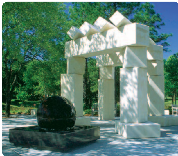
La escultura, The Nature of Things (La Naturaleza de las Cosas) , se encuentra en la Isla Louchery.

Farmacéuticos especialmente entrenados proporcionan revisiones exhaustivas del tratamiento con fármacos mientras duren las consultas con el médico. La atención personalizada y el tiempo extra otorgado por el farmacéutico permite complementar la información que usted obtiene de su médico o farmacéutico local. Información: (904) 953-0404.