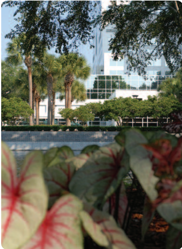
La Clínica Mayo, ubicada en 390 acres en Jacksonville, Florida, es un tranquilo oasis para pacientes y sus familias.

Vestuario y calzado informal y cómodo es lo apropiado. Use ropa liviana en verano, cuando los días pueden ser calurosos y húmedos. Traiga un abrigo delgado para usar en los edificios con aire acondicionado. Un paraguas es conveniente para las impredecibles lluvias de la Florida.