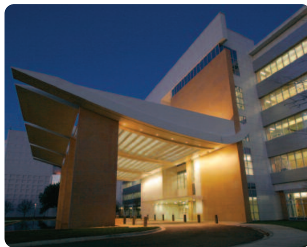
Un nuevo hospital de 214 camas fue inaugurado en abril 2008 en el campus de la Clínica Mayo.

Los pagos se pueden hacer en cualquier ventanilla de registro. La Clínica Mayo acepta pago en efectivo, cheques personales, cheques de viajero, tarjetas Visa, American Express, MasterCard, Discover, Diners Club y Carte Blanche.